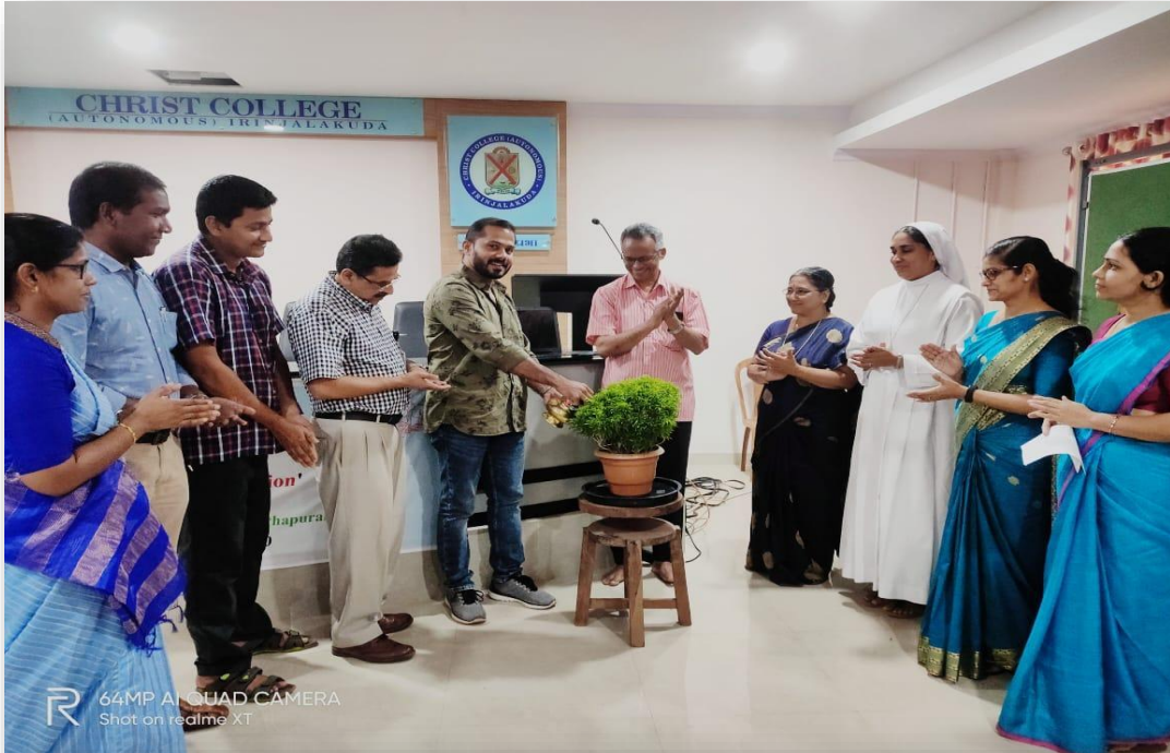
64MP AI QUAD CAMERA Shot on realme XT